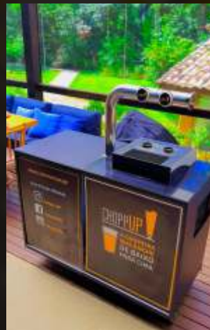
Casamentos e eventos particulares